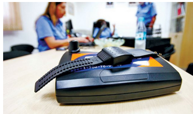
ภาพที่ 2 : อุปกรณ์อิเล็กทรอนิกส์ที่ใช้ตรวจสอบหรือจำกัดการเดินทางและอาณาเขตของผู้ถูกจำกัดที่สวมใส่ไว้ที่ข้อมือในประเทศอิสราเอล (electronic monitoring bracelets)