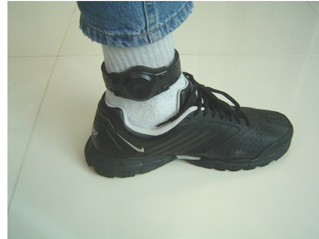
ภาพที่ 1: อุปกรณ์อิเล็กทรอนิกส์ที่สามารถใช้ตรวจสอบหรือจำกัดการเดินทางและอาณาเขตของผู้ถูกจำกัดที่สวมใส่ไว้ที่ข้อเท้าในประเทศบราซิล (electronic monitoring anklets)